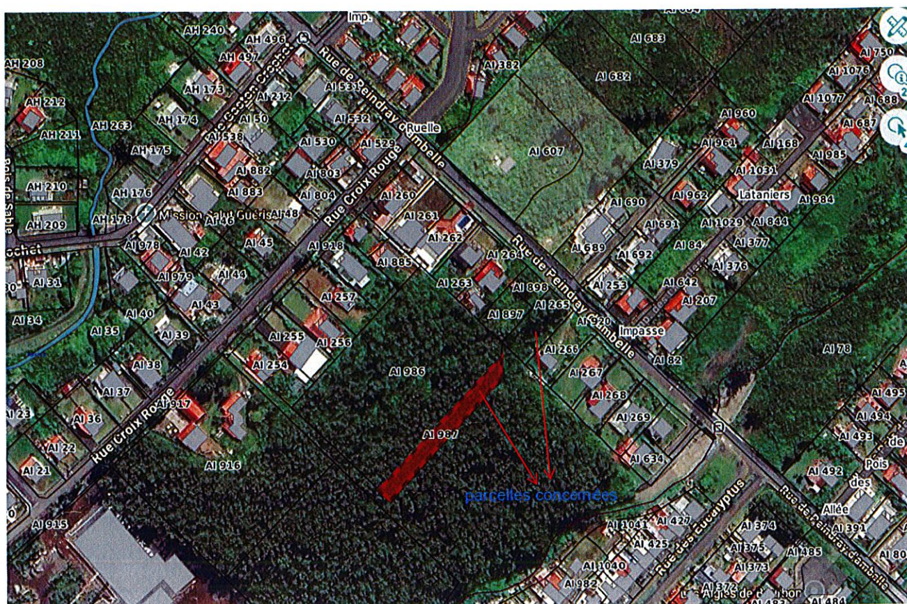
Situation parcelles AI 987 et AI 265

Il rappelle que par délibération en date du 15 octobre 2025, le Conseil municipal a validé la cession du terrain cadastré AI 899 au profit de la société KHEOPS DEVELOPPEMENT pour la création d'un programme de logement social. Dans le prolongement de son opération en cours, la société KHEOPS DEVELOPPEMENT a manifesté son intérêt par courrier en date de 19 novembre 2025 d'acquérir les parcelles AI 987 et AI 265 contiguës à la parcelle AI 899