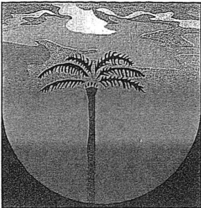
LA PLAINE DES PALMISTES