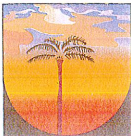
LA PLAINE DES PALMISTES