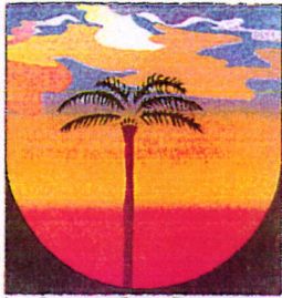
LA PLAINE DES PALMISTES